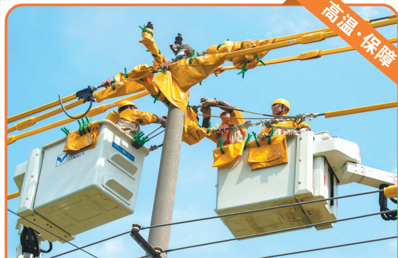
8月21日，在前洲街道，国网无锡供电公司作业人员顶着高温开展带电作业。当日，无锡市最高气温37℃，为保证用电高峰期群众正常生产生活用电，国网无锡供电公司电力工人战高温、斗酷暑，用辛勤汗水守护群众的一片清凉。

从临时市集到“网红夜市”，再到“2.0版”市集，城管部门将不断深化民生需求和城市治理的融合，让夜经济真正融入城市生活的肌理之中，承载起社交、休闲、消费等多重功能，成为市民生活不可或缺的一部分。（卢勇）